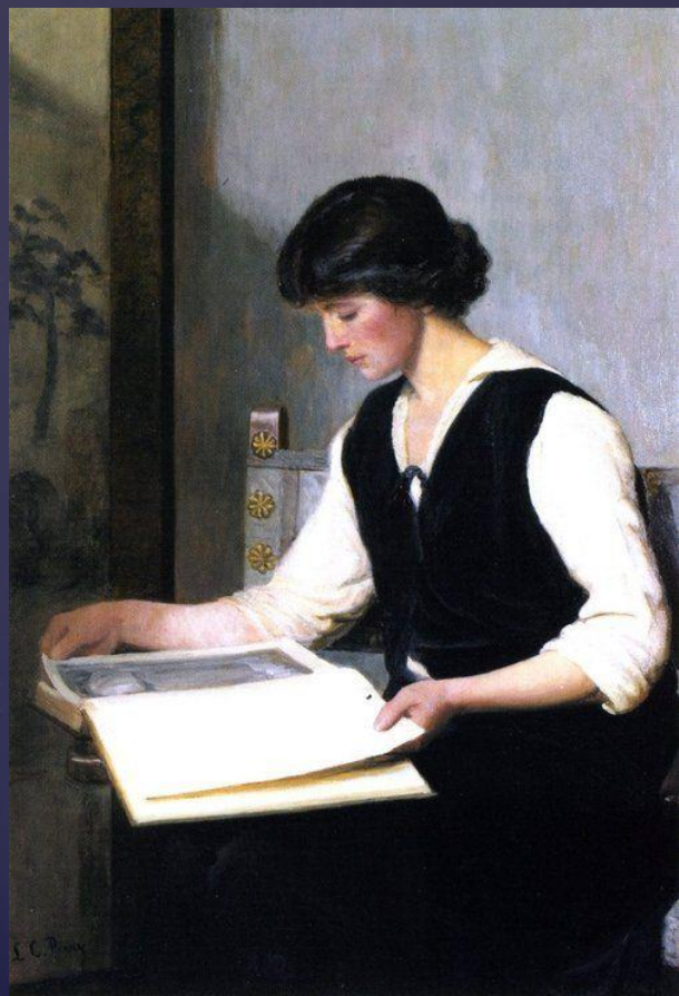
Lilla Cabot Perry