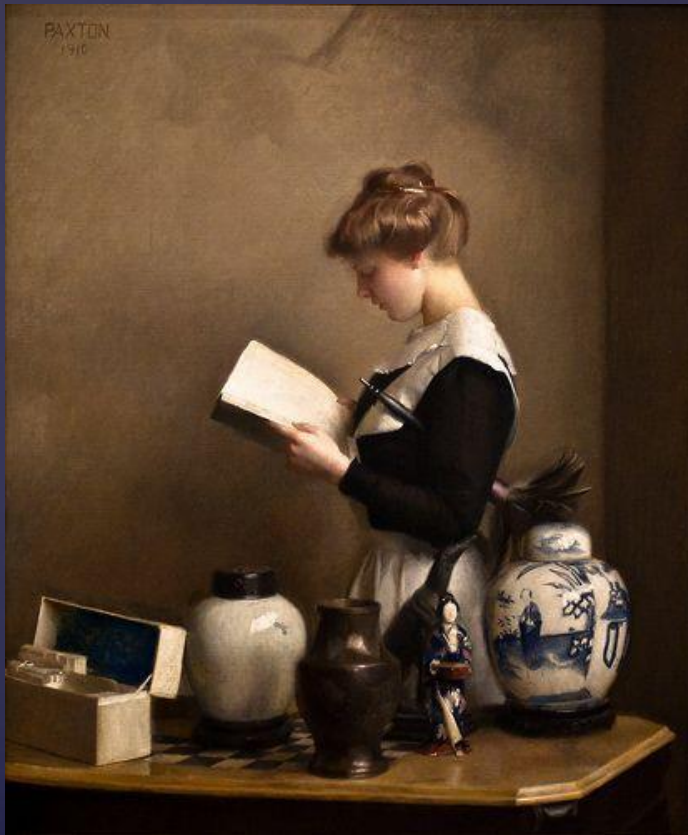
William McGregor Paxton