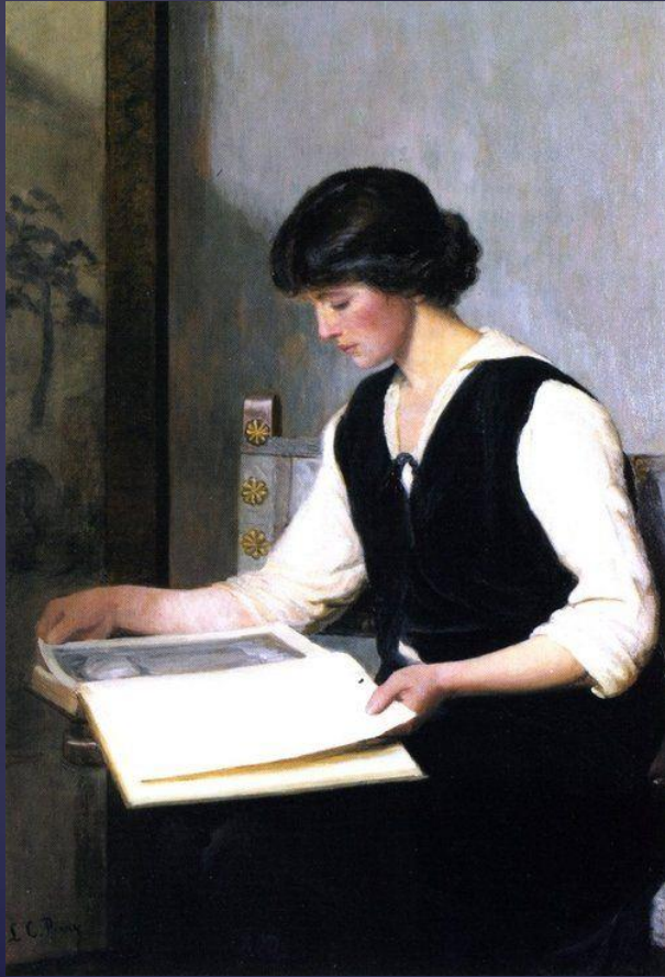
Lilla Cabot Perry