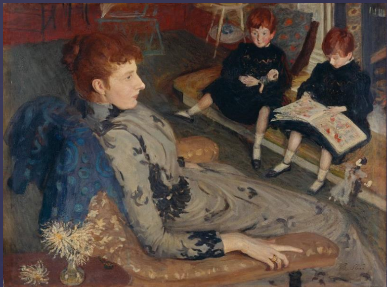
Philip Wilson Steer